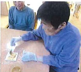
好きなジャムを選んで ジャムロール作り