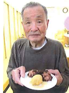
お昼に美味しく いただきます