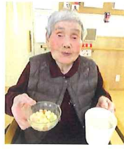
おやつは 雛あられと甘酒